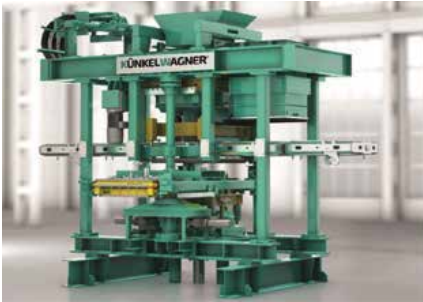
Otomatik Kalıplama Makinası Automatic Moulding Machine